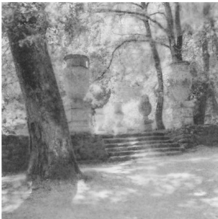
FLORE – Les rêveries de Lavinia

Parallèlement, durant la Foire, un concours photographique est organisé par le Photoclub Paris-Val-de-Bièvre autour de deux thèmes : les objets, les décors, le cadre de la Foire et ses télescopages insolites et le portrait individuel ou collectif des acteurs et du public de la Foire. Les photos seront à envoyer avant le 22 juin minuit à concoursphotofoire@gmail.com